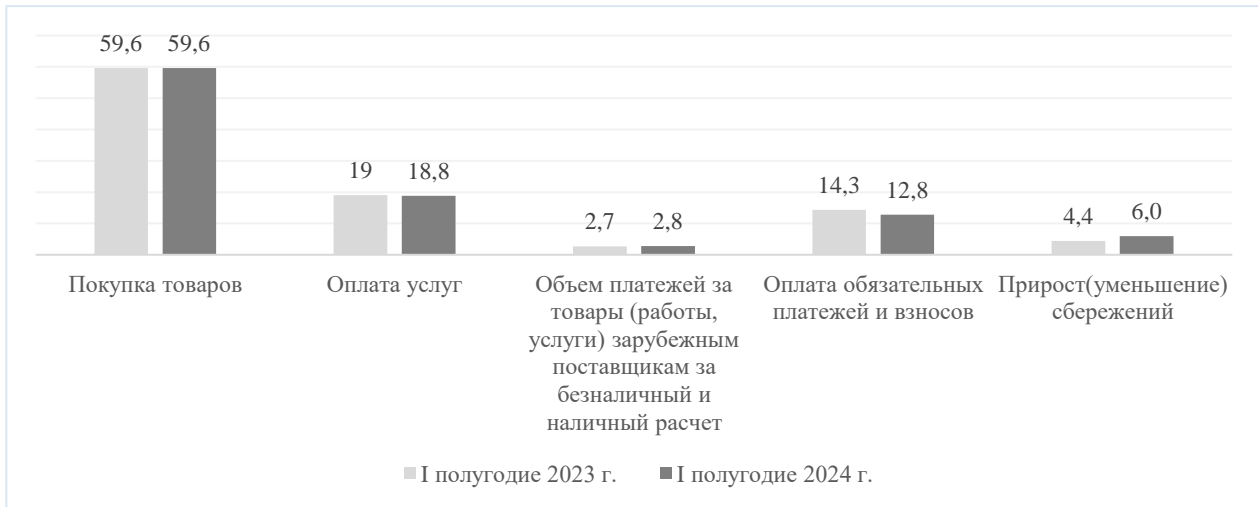
Рис. 1. Изменения в структуре использования денежных доходов населения, % к денежным доходам